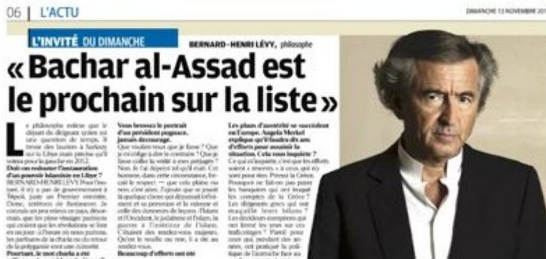
Bernard-Henri Lévy, qui se flatte d'avoir embarqué la France dans la guerre de Libye dans l'intérêt d'Israël, annonce dans « Le Parisien » qu'il a une liste de cibles.

Pour ce qui vous concerne, ami lecteur, vous n'avez aucune raison de me croire plus que l'OTAN, n'étant pas vous-même sur place. Vous avez cependant plusieurs éléments qui devraient vous mettre la puce à l'oreille.