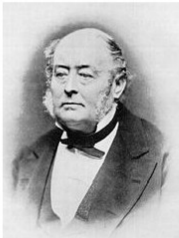
Johann Jakob Bachofen (22 décembre 1815 - 25 novembre 1887)

simplification et qu'après lui, les historiens de l'Antiquité aient recueilli bien d'autres matériaux — tout ceci ne remet pas en question l'essentiel et n'autorise aucun de nos contemporains à juger "dépassées" ses œuvres maîtresses, fruits d'études approfondies et complexes et d'heureuses intuitions.